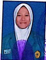
MA DAARUL MUGHNI