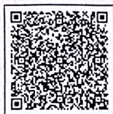
Barcode Keaslian Dokumen

Kulon Progo, 31 Oktober 2025 Penanggung Jawab,