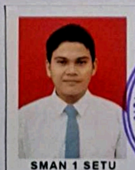
SMAN 1 SETU

Berdasarkan Keputusan Kepala SMAN 1 SETU Nomor 245A/PK.11.01/SMAN1SETU Tanggal 5 Mei 2025 setelah memenuhi seluruh kriteria sesuai dengan peraturan perundang-undangan.