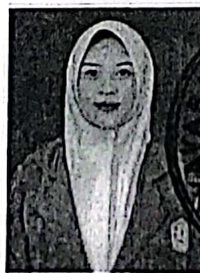
SMA DAYA UTAMA

Berdasarkan Keputusan Kepala SMAS DAYA UTAMA Nomor 030/Kur/SMA.DU/V/2025 Tanggal 5 Mei 2025 setelah memenuhi seluruh kriteria sesuai dengan peraturan perundang-undangan.