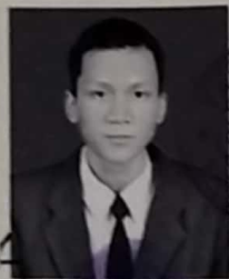
SMK KAPIN JAKARTA TIMUR

dari satuan pendidikan berdasarkan hasil Ujian Nasional dan Ujian Sekolah serta telah memenuhi seluruh kriteria sesuai dengan peraturan perundang-undangan.