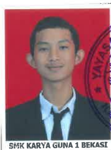
SMK KARYA GUNA 1 BEKASI