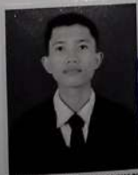
SMK BINA KARYA MANDIRI BEKASI

Berdasarkan Keputusan Kepala SMKS BINA KARYA MANDIRI BEKASI Nomor 716.20.A1/SMK-BM/SKep-V/2025 Tanggal 5 Mei 2025 setelah memenuhi seluruh kriteria sesuai dengan peraturan perundang-undangan.