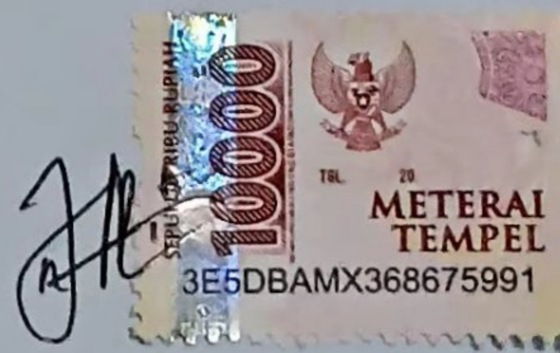
Amelia A'zahra Mahasiswa