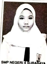
SMP NEGERI 4 SURABAYA